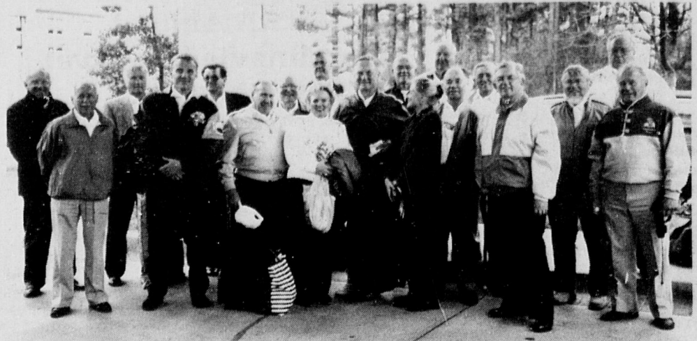
Atlantan Suomi seuran työtöille laulettiin serenadeja.