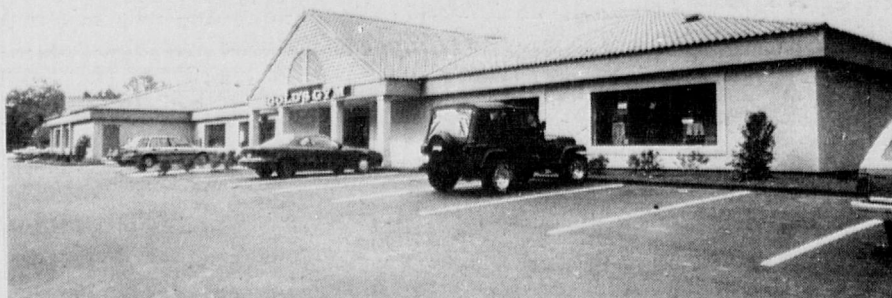
Nurminen Construction, of Hawthorne (NJ), has eight different 'WedgCor' building styles to offer owners with specific needs, ranging from auto showrooms to suburban shopping centers and health clubs like the Gold's Gym shown above.

Nurminen offers full service on WedgCor buildings to all owners, from preconstruction planning, budgeting and design, through building construction and facilities management, on buildings of one to three stories in height. With bay lengths ranging up to 50 feet, there are no width restrictions whatsoever on a