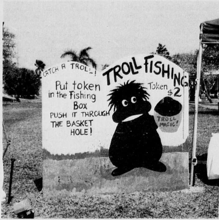
Troll fishing for children.