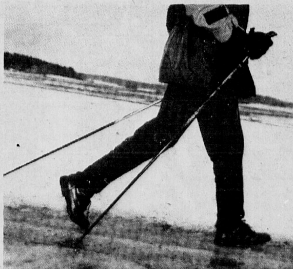
Sauvakävely on suosittu ulkoilu muoto kautta Suomen.

Kaikenlaisia vakuutuksia . . . Puhutaan Suomea