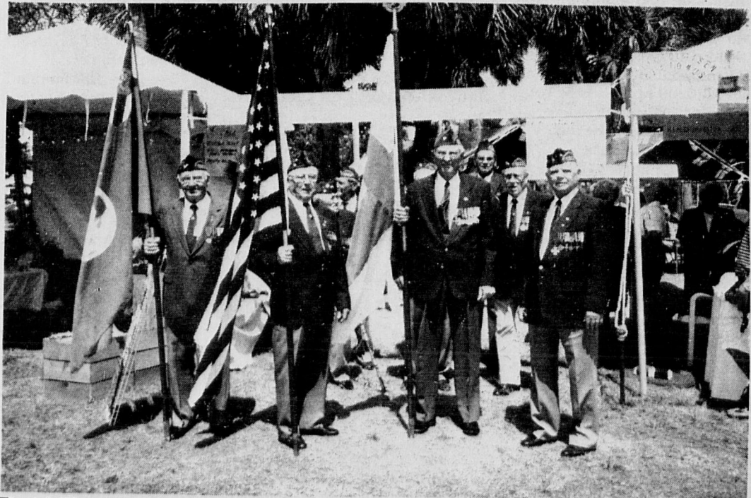
Finnish War Veterans held a service at Bryant Park.