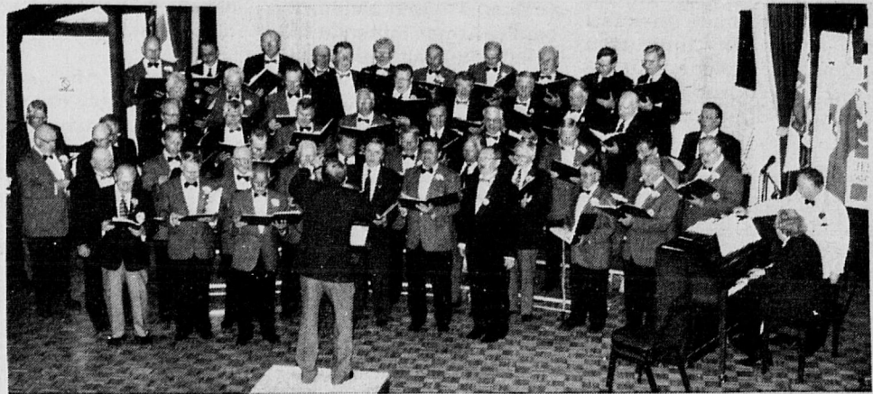
Floridan Laulumiehet, marking 30 years of singing, organized a group concert by various North American Finnish male choruses. Participants were from Chicago, Toronto, Thunder Bay, Sudbury and Sault Ste Marie.