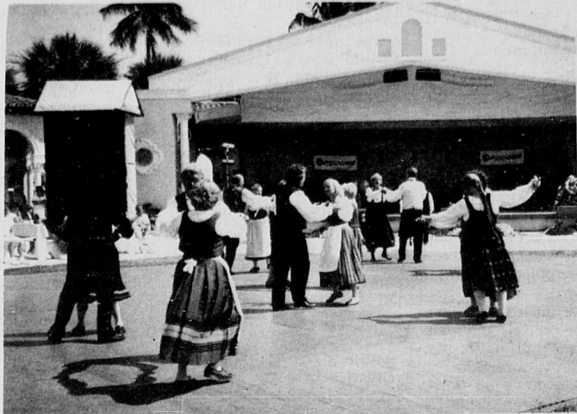
Katrillit of Florida and Sisu of Toronto entertained with folkdancing.