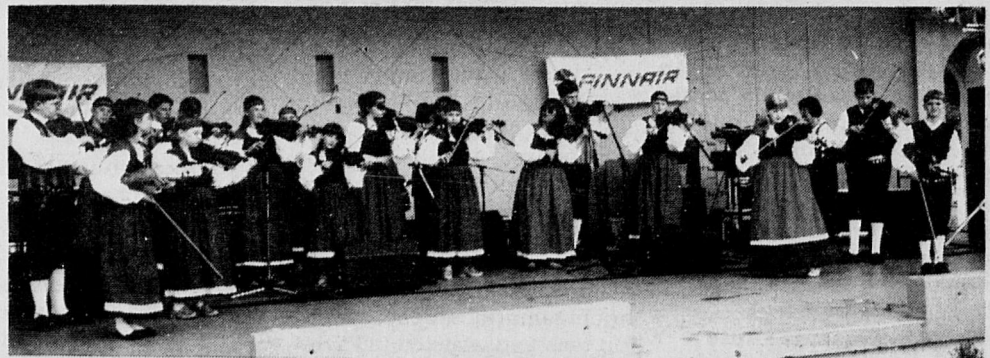
Singing Strings performing.