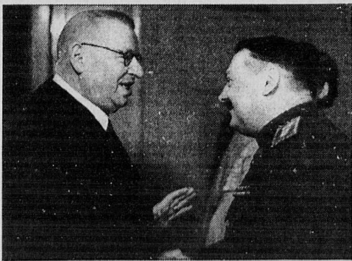
Kenraalileversti Andrei Zhdanov tervehtimässä pääministeri J.K. Paasikiveä lokakuun vallankumouksen 28-vuotisjuhlavastaanotolla Helsingissä 5. marraskuuta 1945.

Suureksi osaksi presidentti J.K. Paasikiven taipumattomuus sai neuvostoliittolaiset luopumaan alkuperäisistä vaatimuksistaan.