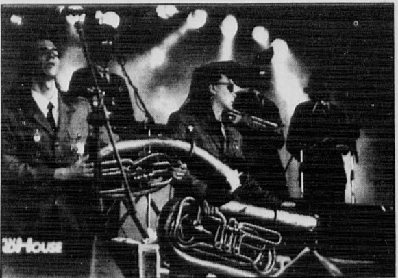
Cannesin filmijuhlaväki saa ällistellä seuraavaksi Leningradin lehmipojkia.

Ohjelmistoa on osittain uusittu, mutta takuuvarmasti konsertissa kuullaan jo Senaatintorilla suuren suosion saaneet rock-klassikot Happy Together, Stairway to Heaven sekä venäläiset balladit Kalinka ja Katjusha.