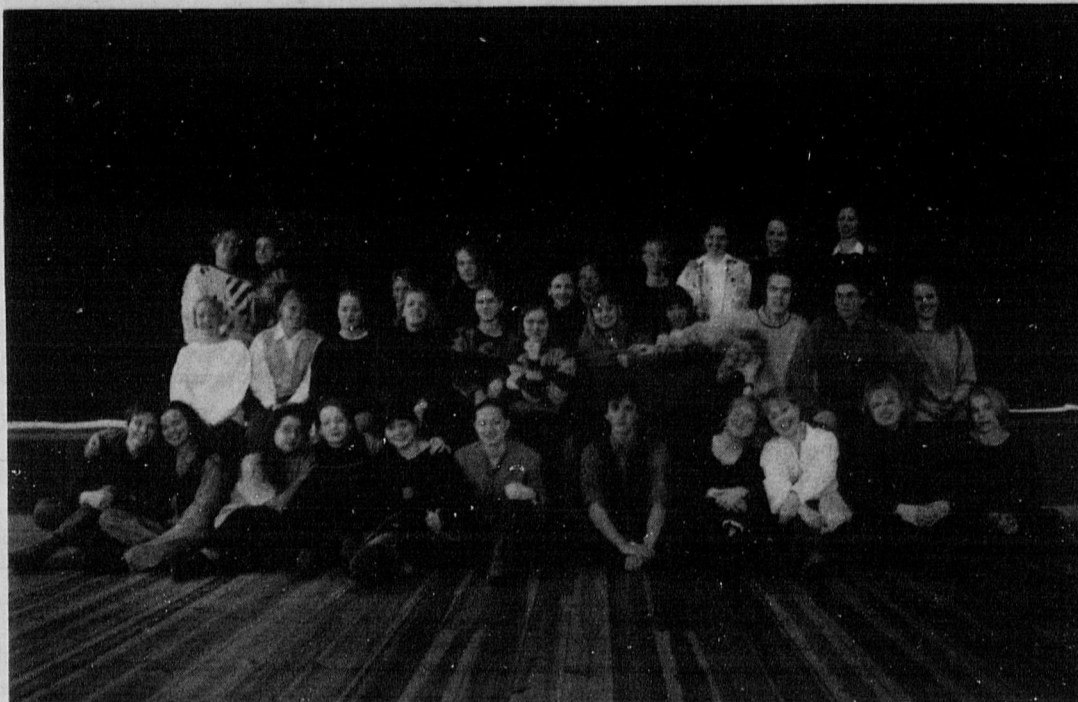
The Sibelius High School Chamber Choir, above, from Helsinki, Finland, is coming on tour. They will be singing at All Souls Congregational Church in Bangor (ME) on Sunday, May 1.

Fazer Music Inc. and the turn to SIBELIUS page 10