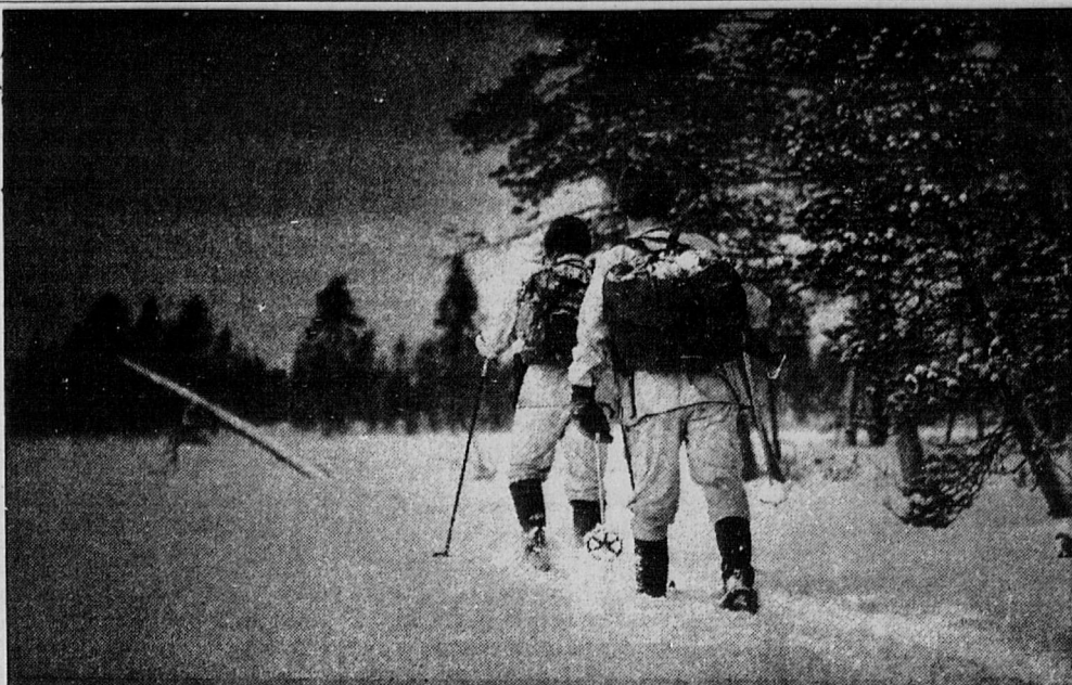
Kahden miehen rajapartio tarkastuskierroksella Norjan, Neuvostoliiton ja Suomen yhteisen rajan tuntumassa 1979.

Toisinaan itäloikkari polteli Suomen viranomaisien hyp- pystä niin, ettei Neuvostoliitto