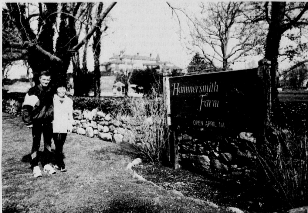
Hammersmith Farm Newportissa (RI) oli Kennedy-kauden kesäinen Valkoinen talo, presidenttiperehen kesäkotit. Tältä portilta tapahtui lähtö Paavo Nurmen kahden mailin juoksussa.