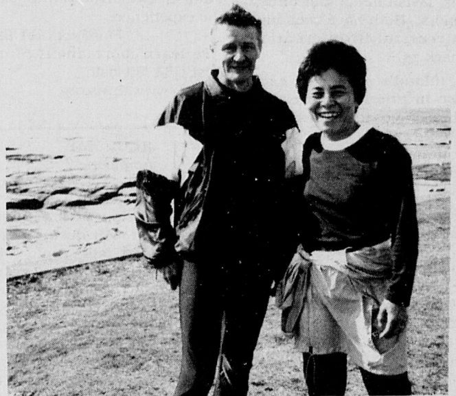
Paavo Nurmi-juoksun kaksi osanottajaa pääsivät hyviissä voimin maallin täysmittaisella radalla Ocean Drivella Atlantin kevdsten aaltojen tuntumassa.

Keskustelimme myös Kreikan klassisesta juoksusta, joka alkoi Maratontasanteella ja päättyi Ateenaan. Olympiakisoissa 1896 alkoi juoksun kehitys siihen pisteeseen, missä se on nyt. Maratonjuoksut ovat valloittaneet maailman. Maratonista juostaan kaikkialla. Maraton-