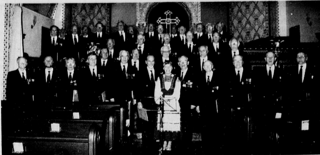
New Yorkin konsertin jälkeen. Takana loistavasti onnistunut kiertue, joten on syytä hymyyn.

Konserttipaikalta palasimme takaisin hotelliin, jonka sympaattinen baarimestari piti ystävällisesti ravintolan meitä varten auki, jotta saisimme edes hiukan juhla vappuaattoa. Pikkuhiljaa ravintolaan alkoi kerääntyä matkalaisia ja iltaa vietettiin laulaen ja vitsejä kertoen. Varsinaisia ilopillereitä nuo ystävämme olivat.