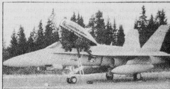
Suomen ilmavoimat ovat saaneet tänä vuonna jo kaksi Hornetia lisää.

Hän kertoi, että ilmavoimat ja teollisuus suunnittelevat