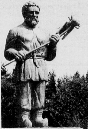
Accompanying the article in Country magazine is this picture with the caption: "Wooden statue of St. Urho, Finland's patron, occupies a special spot in Menahga, Minnesota."